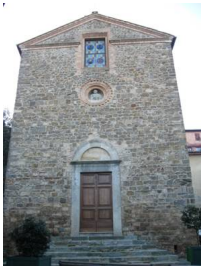
Chiesa di San Pietro

Nel 2001 il Quartiere di Pianello a Montalcino acquista l'edificio che si trovava in uno stato di degrado, con la consapevolezza di riportarlo al suo antico splendore. Per raccogliere fondi per il restauro sono state inviate in tutto il mondo centinaia di E-mail. Quello che poi è stato fatto è sotto gli occhi di tutti, un restauro lungo e laborioso terminato solo nel 2009 che ha portato al recupero di questo gioiello.