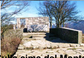
Sulla cima del Monte Le Coste si trova la tomba di Curzio Malaparte (1898-1957)