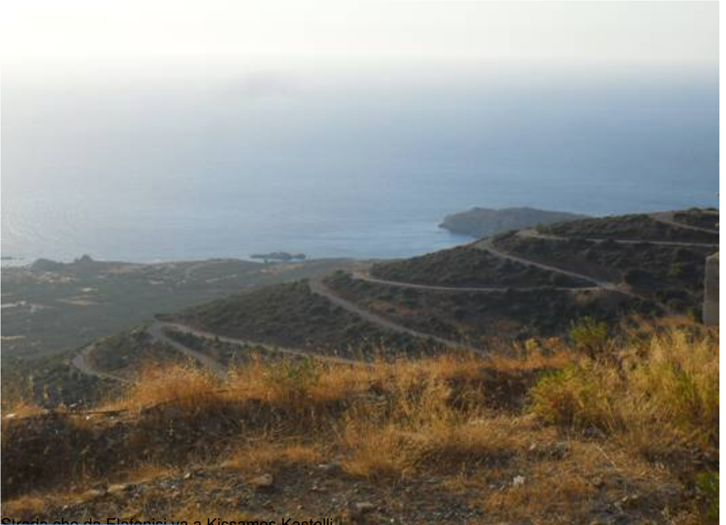
Strada che da Elefenisi va a Kissamos Kastelli