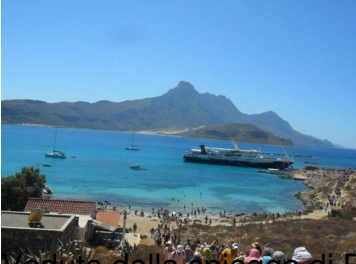
Veduta delle spiagge di Palos da Gramvousa Bay