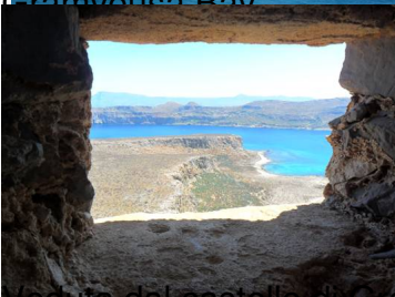
Veduta dal castello di Gramvousa Bay