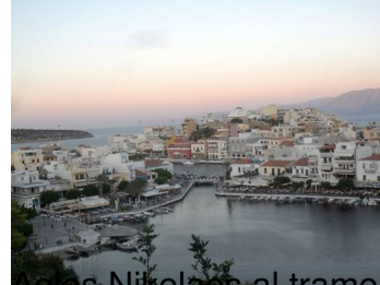
Nikiforos al tramonto