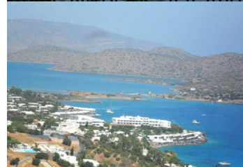
Isola Kalymnos collegata alla terraferma da una strada piena di Mulini a vento