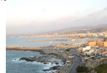
Vedute di Rethymno dal castello