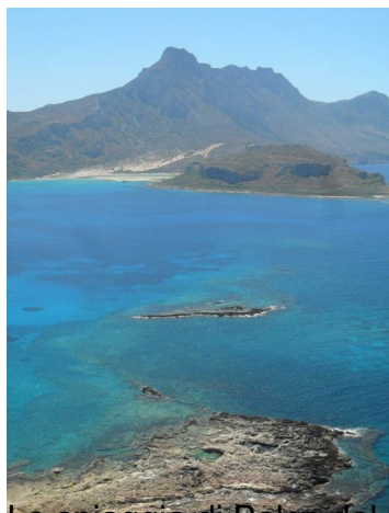
La spiaggia di Rames del castello di Gramvousa Bay