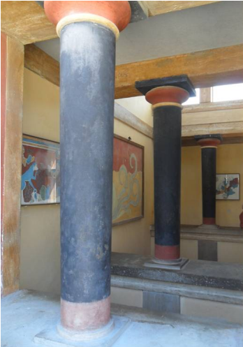
Knossos palazzo reale