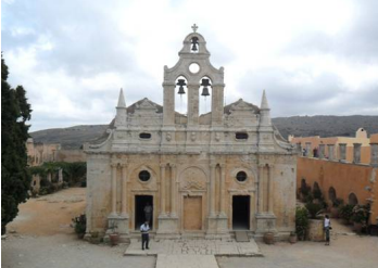
Monastero di Moni Fotou