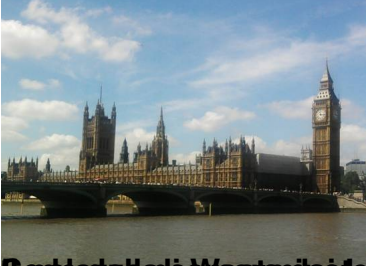
Parlamento e di quella dei Comuni