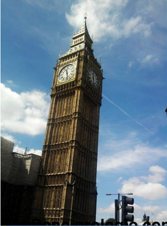
con la sua alta torre.