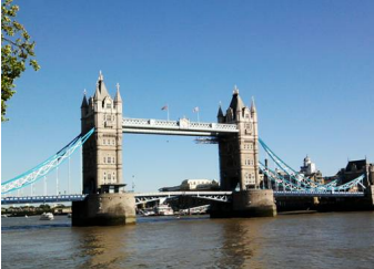
Tower Bridge famoso ponte di Londra