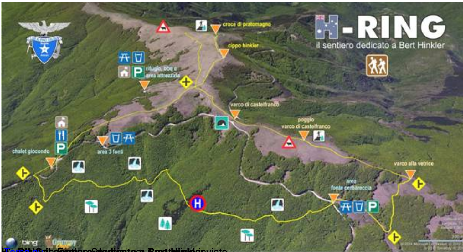
H-RING il sentiero dedicato a Bert Hinkler